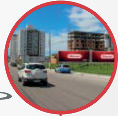
AV. PEDRA BRANCA