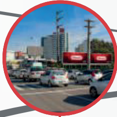
SÃO JOSÉ AV. PRES. KENNEDY