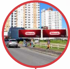
PALHOÇA AV. ATÍLIO PAGANI