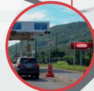
SC 401 NO CAMINHO DAS PRAIAS

Outdoors e Frontlights nas principais vias de FLORIANÓPOLIS, SÃO JOSÉ, BIGUAÇU E PALHOÇA